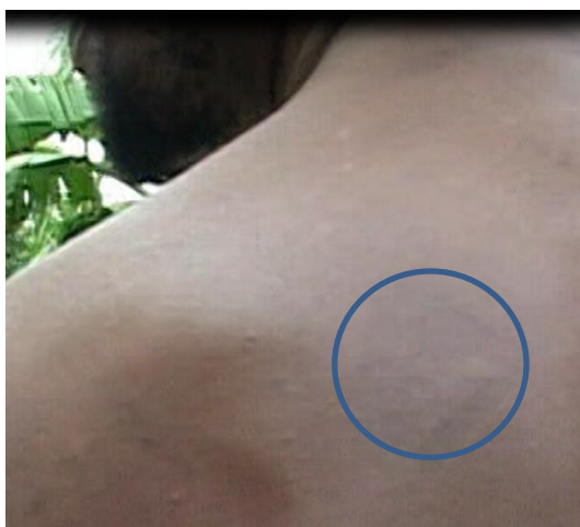
Abb. 2 Abheilung sekundärer Geschwüre bei AIDS Patienten (6 Wochen Einnahme von Nanovit® Immuno) Links: voll repigmentierter Zustand nach drei Monaten; unten: In Granulation befindlicher Wundrand

Das subjektive Befinden war bei allen 40 Patienten verbessert und in einzelnen Fällen gab es spektakuläre Wundheilungen bei sekundären Ulcerationen.